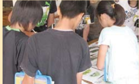
環境にやさしい買い物って？おうちの人にも教えてあげよう！ 平井小学校 6年生(6/10)

インタープリターによる出前授業も、毎年グレードアップ。先生と相談しながら授業のプログラムを組み立てています。参加・体験型の授業で、子どもたちの集中力もUP！