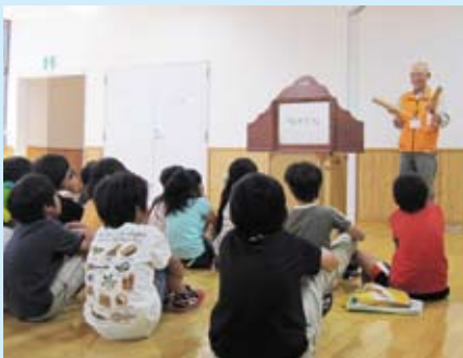
一番手は、若園小学校のみなさん。今年も子どもたちの声がひびきます。