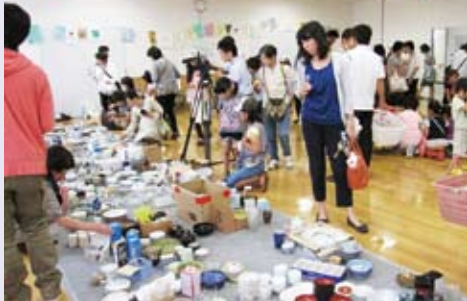
大盛況の「リユース広場」。お気に入りは見つかったかな？

6周年となる今年は、子ども服・食器・本・おもちゃをゆすり合う「リユース広場」に初挑戦。皆様のご協力でたくさんのグッズが集まり、有意義な交換会になりました。当日は、親子連れを中心に1,000人を超える来館者でにぎわいました。