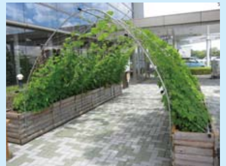
今年も「緑のトンネル」が登場！ゴーヤやへちまを植えました。