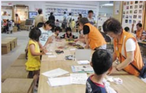
「エコ屋台村」でぶちエコ体験。インタープリターが活躍！