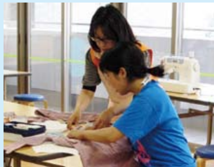
着なくなったシャツなどが素敵なエプロンに变身♪