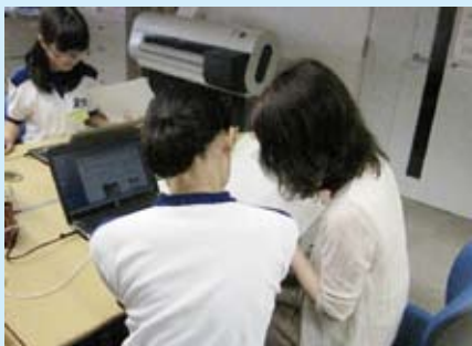
eco-T日記(ブログ)にも挑戦！ 笑顔で仕事に取り組んでくれました。