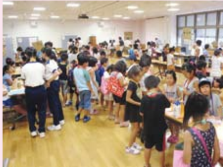
みんなのアイデアでまちが成長！今年 は町長選挙も実施しました。 (エコットキッズタウン 7/31-8/3)

今年の夏休みも、たくさんの来館者でにぎわいました。夏の暑い日に涼しい場所を共有(シェア)して、節電にもつながるクールシェア！eco-Tで楽しくお得に過ごしていただけたでしょうか？