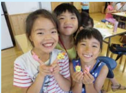
蚕のまゆを利用したかわいい指人形が完成！ 自然とふれ合い、ものづくりを楽しみました。