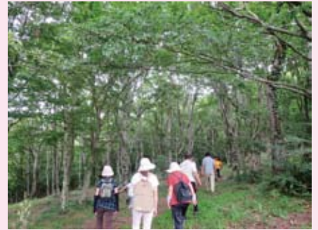
ブナ林の保水機能は山のめぐみのひとつ です。イノシシの肉もいただきました。 (いきものめぐみ塾 8/8)

豊田市では、みなさんの体験や感想を 募集中(～10/14)。 ユニークな取り組みは、市のホームペ ージで紹介されます♪