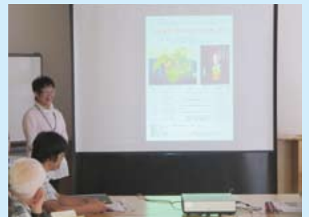
インタープリターが新しく企画した講座です。 自然や環境を写真とともに表現します。