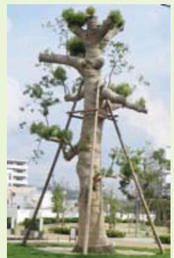
とよたエコフルタウンに移植されたクスノキ

*申込みは、10月19日(日)10時から、eco-T事務局(TEL: 26-8058)まで