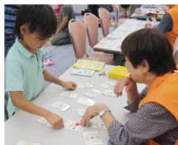
カードゲームで楽しく3Rが学べます