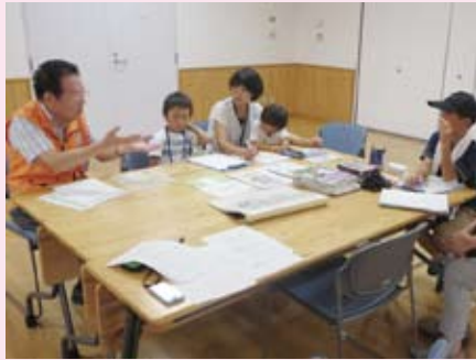
「何を調べたい？」インタープリター と相談してから見学へ！ (自由研究応援企画 8/5、7)