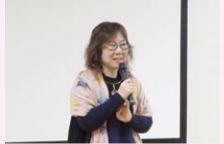
「はじめの一步を踏み出した白杵市の農家の姿を伝えたかった」 (映画『100年ごはん』の監督大林千栄葵さん)