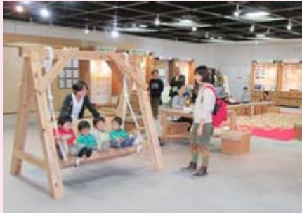
みんなでブランコに乗ったよ！ (木育ひろば 12/5~20)

前日の19日(土)には木工ワークショップも実施。曲げわっぱやお箸、つみ木をつくる体験を楽しみました。展示室には、根羽杉でつくったブランコやおセロ、たくさんのつみ木を設置。大人から子どもまで、木のぬくもりを感じていました。