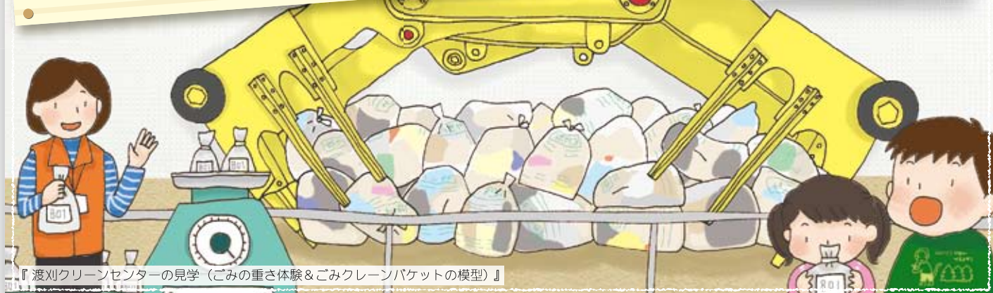
『渡刈クリーンセンターの見学（ごみの重さ体験&ごみクレーンバケットの模型）』