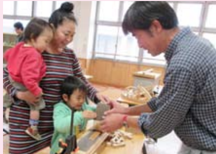
ぼくのお弁当箱、つくるんだ！ (木工ワークショップ・曲げわっぱづくり 12/19)