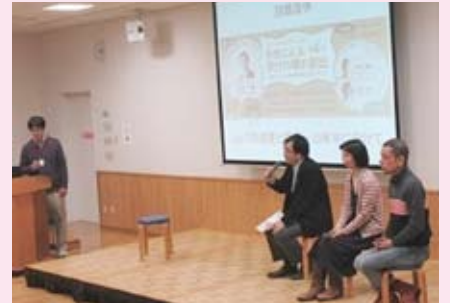
eco-Tの今後に向けてのアドバイスも！ (エコットフォーラム・トークセッション 12/20)