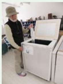
家庭で使える非電化冷蔵庫