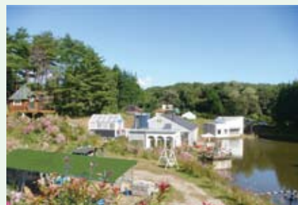
建設中の「非電化工房」(栃木県那須町)

エコットフォーラムは、年に1度eco-Tにかかわる人や環境に関心のある人が集い、最先端の活動や考え方にふれて、日ごろの活動、仕事、くらしに活かしてもらおうという趣旨で開催しています。