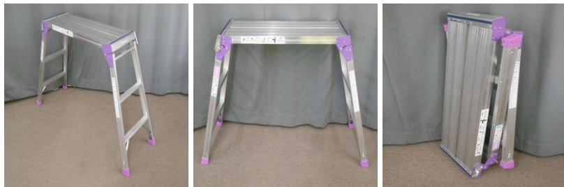
脚立(3段、折りたたみ式)