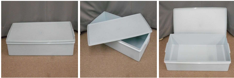
ふた付収納ケース