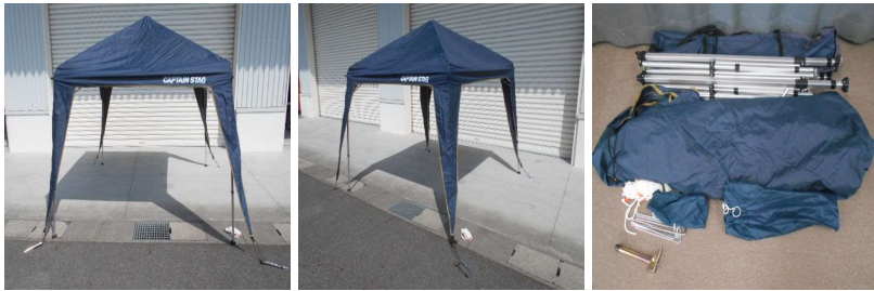
テント(折りたたみ式)