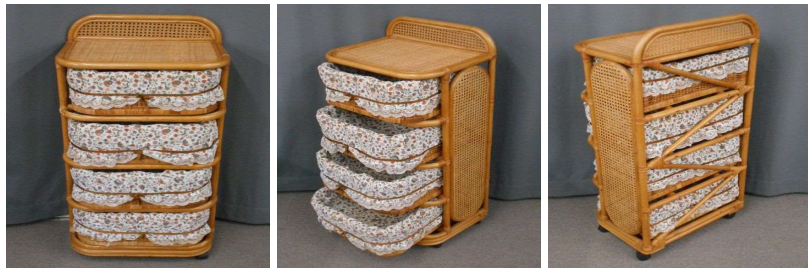
籐のチェスト(4段、キャスター付)