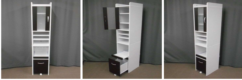
棚(9段、コンセント付)