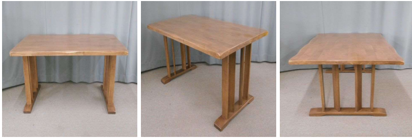
ダイニングテーブル