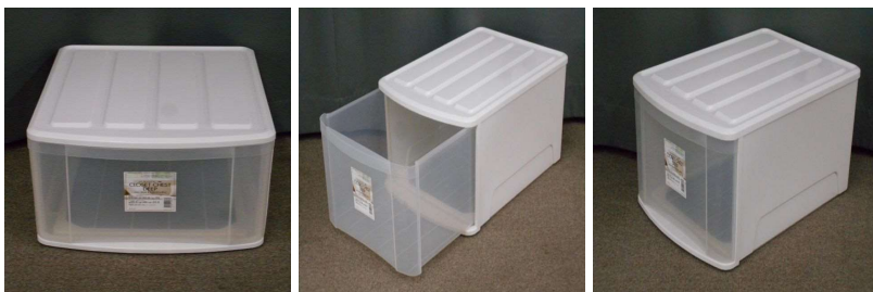
引出し式収納ケース