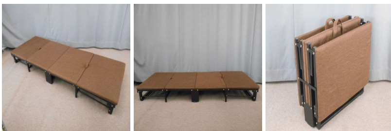
ベッド(折りたたみ式)