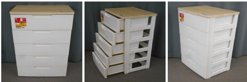
引出し式収納ケース(5段)