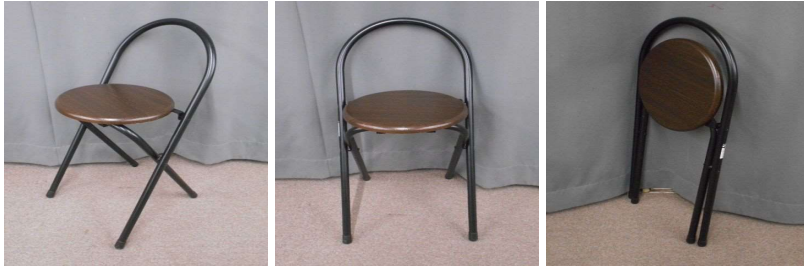
イス(折りたたみ式)