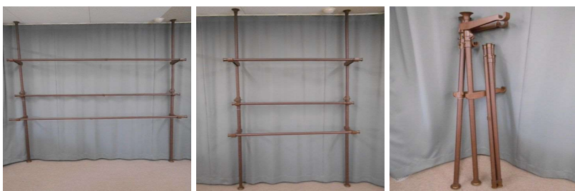
物干し(突っ張り式、竿3本付)