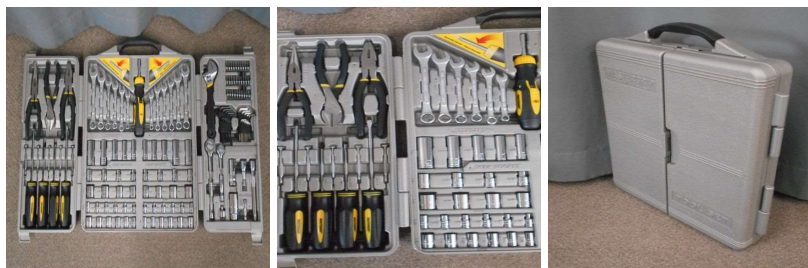
工具セット(ケース付)