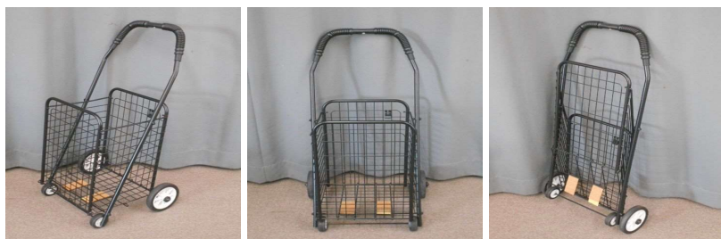
カート(折りたたみ式)