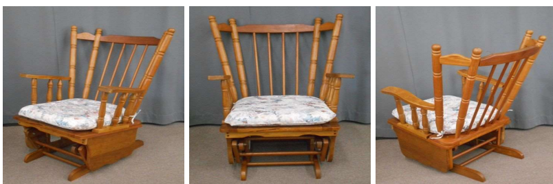
ロッキングチェア