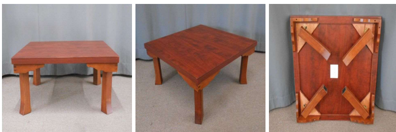
座卓(折りたたみ式)