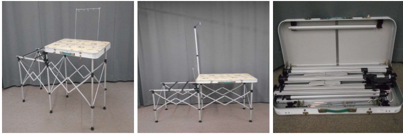
レジャーテーブル (折りたたみ式)