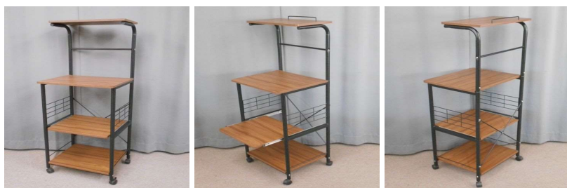
キッチンラック(4段、キャスター付)