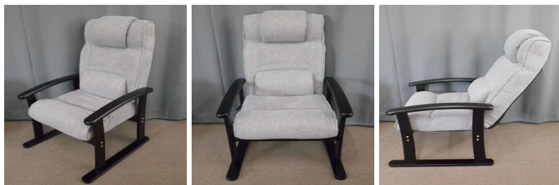
イス(リクライニング式)