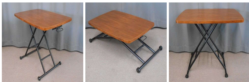
テーブル(昇降式、キャスター付)