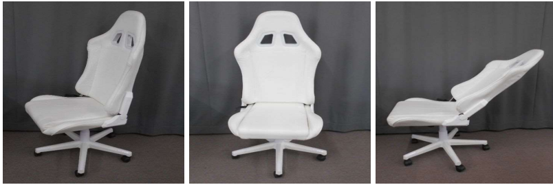
イス(回転、リクライニング式、キャスター付)